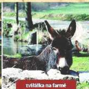
zvířátka na farmě