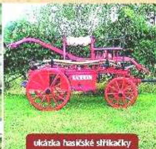
ukázka hasičské stříkačky