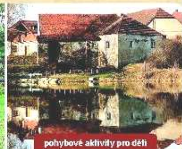
pohybové aktivity pro děti

VÍCE INFORMACÍ NA barbora.hozova@csop.cz , NEBO TELEFONU 317 845 169