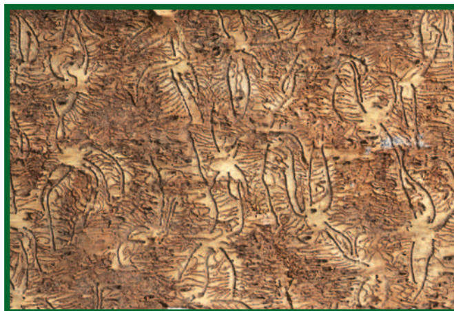
Požerky lýkožrouta lesklého

K odchytům lýkožrouta lesklého jsou vhodné nárazové typy lapačů (štěrbinové lapače typu Theysohn nebo křížové lapače typu Ecotrap). Sítko ve sběrných kontejnerech musí být dostatečně husté, aby nedocházelo