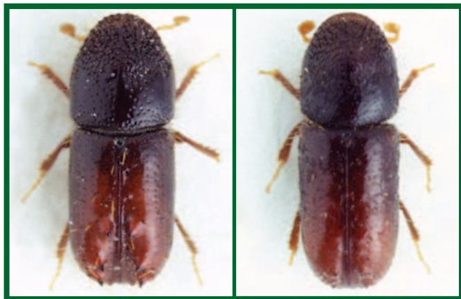
Vlevo sameček, vpravo samička lýkožrouta lesklého (zvětšeno 25x)

Nejčastěji jej nalézáme na smrku ztepilém, ale napadá i některé další druhy smrku (u nás např. smrk pichlavý), dále modřín opadavý, borovici lesní a další borovice – vejmutovka, blatka, kleč, borovice černá.