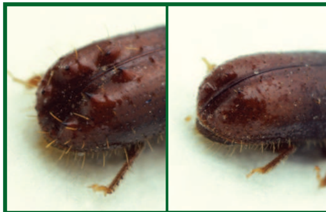
Vlevo zadní část krovek samečka, vpravo samičky lýkožrouta lesklého

Mezi nejvýznamnější predátory lýkožrouta lesklého patří brouk z čeledi Temnochilidae, kornatec dlouhý ( Nemozoma elongatum Latr.). Tento brouk je úzký, válcovitý, takže může snadno prolézat chodbami l. lesklého, kde se živí jeho larvami. V poměrně vysokém počtu bývá nalézán v odchytch l. lesklého v lapačích, kde jeho podíl může činit až 4 % odchytu l. lesklého. Další predátoři z řádu brouků, i když již méně významní, jsou z čeledi střevlíkovitých (Carabidae), drabčikovitých (Staphilinidae), mršňikovitých (Histeridae), potemníkovitých (Tenebrionidae), pestrokrovečnickovitých (Cleridae), lesknáčkovitých (Nitidulidae) a jim příbuzné čeledi Rhizophagidae.