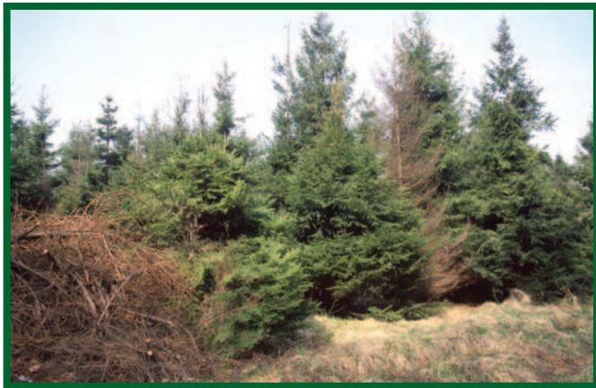
Odstraňování těžebního odpadu je základním preventivním opatřením proti lýkožroutu smrkovému; vpravo na obrázku smrková souše po napadení I. lesklým

k unikání zachycených jedinců. K navnazení se používají odparníky určené k lákání tohoto druhu, které jsou uvedeny v „Seznamu povolených přípravků na ochranu rostlin“, který vydává Ministerstvo zemědělství ČR ve spolupráci se Státní rostlinolékařskou správou Brno, nebo v „Seznamu povolených přípravků na ochranu lesa“, sestavovaného pracovníky VÚLHM Jíloviště-Strnady (tento seznam kopíruje a pro praxi doplňuje výše uvedený seznam), a to podle platných etiket (dále jen „Seznam“). Odparníky se vyvěšují těsně před předpokládaným začátkem rojení, tj. v nižších polohách zpravidla v druhé polovině dubna, ve vyšších polohách poněkud později.