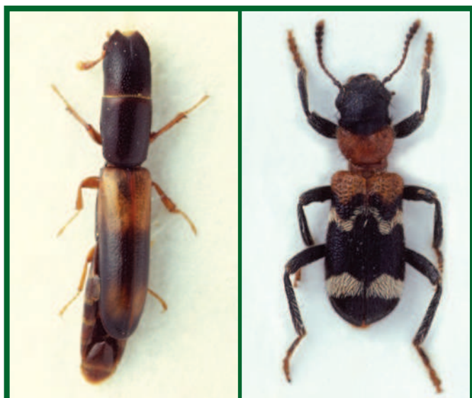
Predátoři lýkožrouta lesklého: vlevo kornatec dlouhý ( Nemozoma elongantum ), zvětšeno 14x, vpravo pestrokravečník mravenčí ( Thanasimus formicarius ), zvětšeno 9x

Významné jsou i některé druhy dvoukřídlých (např. z rodu Medetera ) a blanokřídlých (např. chalcidka Psychophagus abieticola Ratz. nebo lumčíci rodu Spathius , Ecphyllus a Cosmophorus ), jejichž larvy parazitují na vajíčkách, případně larvách I. lesklého. Na dospělých parazitují roztoči (např. Uropoda polysticta Vitzth.) nebo cizopasně hlístice (např. zástupci rodů Panagrolaimus nebo Parasitophelenchus ).